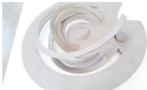
Obr. 22–28. Díla Karla Malicha v kombinaci s volnými interpretacemi studentů na Malichovi objekty představené na výstavě Utopické projekty ve Fait Gallery.

Výzvou se může stát sbírání různorodého materiálu v určité barevnosti a jeho následné uplatnění v prostorové kompozici – z různorodých materiálů necháme „vyrůst“ např. fantazijní architekturu. Vzniklé kompozice také vybízejí k diskusi nad problematikou moderní architektury a staré zástavby. Mohou představit zajímavé budovy, ale i vize, které nebyly nikdy realizovány, přesto jsou uchovány v podobě návrhů či objektů. Architektonické vize budoucnosti inspirovaly např. Karla Malicha (1924–2019). 2 Jeho modely i prostorové objekty z různorodých materiálů dávají velký prostor tvořivě díla interpretovat nebo v nich hledat inspiraci pro vlastní tvorbu, ve které budou uplatněny dostupné, často zbytkové materiály.