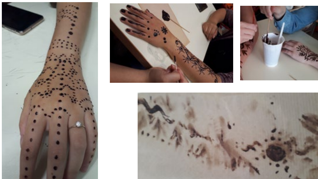
Obr. 13-16. Ornamenty aplikované na tělo a jejich otisky.

ornament na svém těle, můžete použít dostupnější prostředek, který nabízí možnost kresby na tělo, výsledek však nebude trvanlivý – použijte malé množství kakaového prášku rozmíchaného v tělovém mléce. Jako kreslířský nástroj můžeme použít různé dostupné instrumenty jako špejle, vatové tyčinky, štětce, nabízí se i různé kartáčky, hřebeny či vidličky, kterými můžeme nejen kreslit, ale využít i jejich zajímavé otisky. Výslednou kresbu můžeme zaznamenat fotografií nebo otisknout do svého podkladového materiálu.