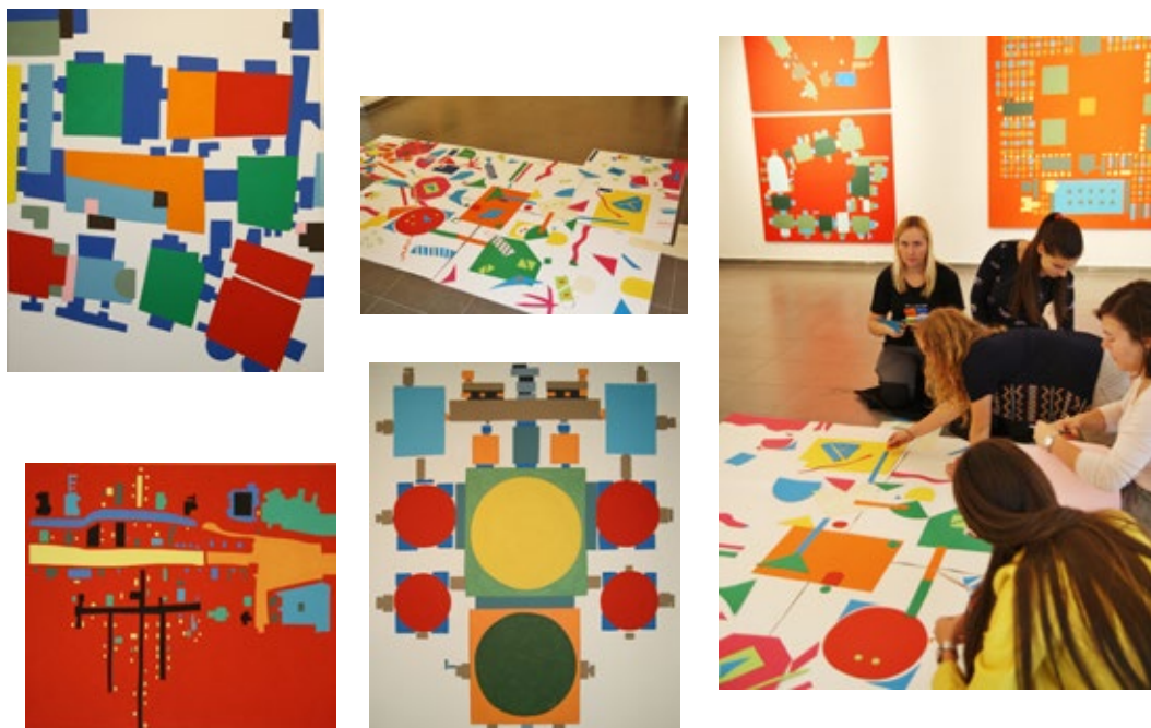
Obr. 17-21. Výtvarná aktivita s barevnými geometrickými tvary a velkými formáty podkladového materiálu.

Protože barevné papíry patří k dostupným materiálům, byly využity záměrně nastříhané geometrické tvary z papíru (tvary není třeba rýsovat, předkreslovat). Nabízí se také využití odstřížků barevných papírů z předchozích výtvarných činností, všechny tvary je možné kombinovat. Pak je už můžeme uspořádávat v ploše – pracovat s nimi jako se stavebníci. Mohou vznikat kompozice nepravidelného tvaru nebo kompozice vycházející z geometrie – záleží na záměrech a velikosti podkladového materiálu. Abychom podpořili spolupráci na společném díle, spoluautoři se mohou v ploše posunovat po obvodu svého „města“ nebo se jinak pohybovat (např. ve dvojicích si měnit stanoviště apod.). Mají tak příležitost obohacovat společnou kompozici o vlastní – jedinečné – nápady, domlouvat se na výtvarném řešení, všimnout si vztahů mezi barevnými plochami nebo je záměrně tvořit (uplatněním odstínů barev, kontrastu apod.). Výsledná díla můžeme zdokumentovat, nabízí se i vyhledávání a zaznamenání zajímavých detailů fotografií. Následně je také možné realizovat prostorové řešení, a to s využitím nastříhaných papírových tvarů a dalších prvků z barevných papírů. Ke stříhání nůžkami přibude tvarování papíru a lepení na podkladovou plochu tak, aby vznikl reliéf. Je možné nabídnout i prostorové řešení z dostupného materiálu – např. dřevěné stavebnice mohou být kombinovány s dalšími dřevěnými tvary.