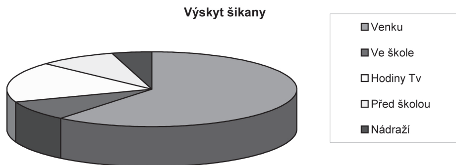
obr. 1: Výskyt šikany u sledovaného souboru adolescentů

Agresor, který oběti ubližoval, byl v 35 % chlapec, 22 % skupina chlapců, 10 % skupina chlapců i dívek, dále se objevil i učitel (5 %) nebo neznámý adolescent (obr. 2).